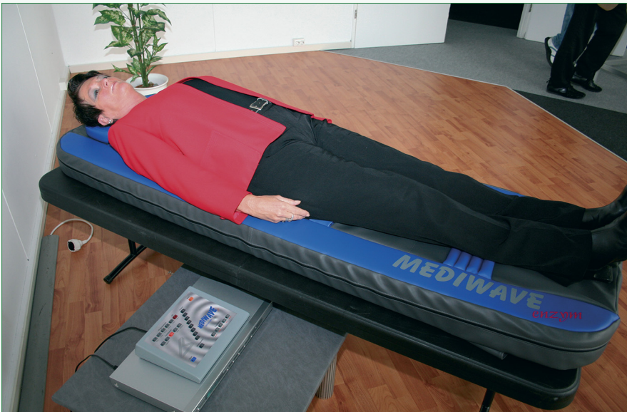
Abb. 4: Die Therapie mit den „heilenden Tönen“ wird sofort als wohltuend und entspannend empfunden