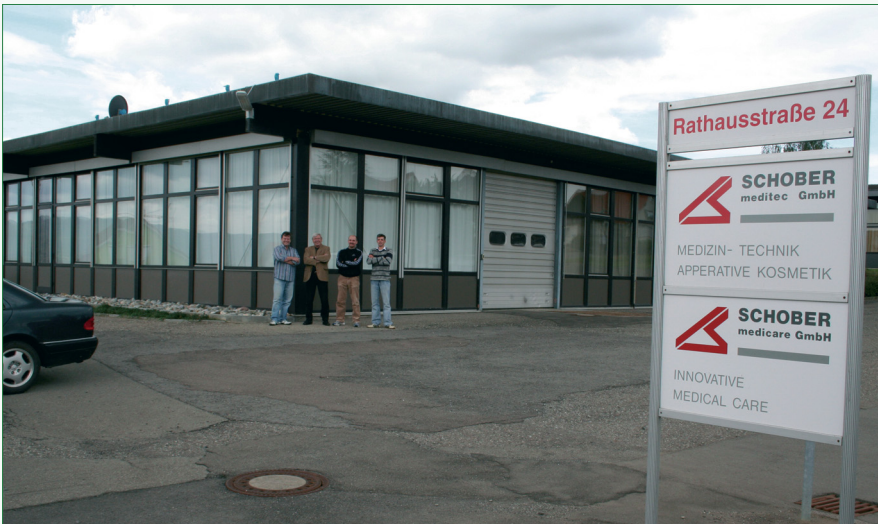
Abb. 6: Die Zentrale der SCHOBBER medicare GmbH in Hechingen

nach Übermüdung der Muskulatur. Gute Dienste und vor allem gute Erfolge, die sich auch herumgesprochen haben. Soweit, dass derzeit erwogen wird, ob die Mediwave auch einen wichtigen Teil leisten soll bei der Vorbereitung des Österreichischen Fußball-Nationalteams auf die Europameisterschaft in Österreich und der Schweiz.