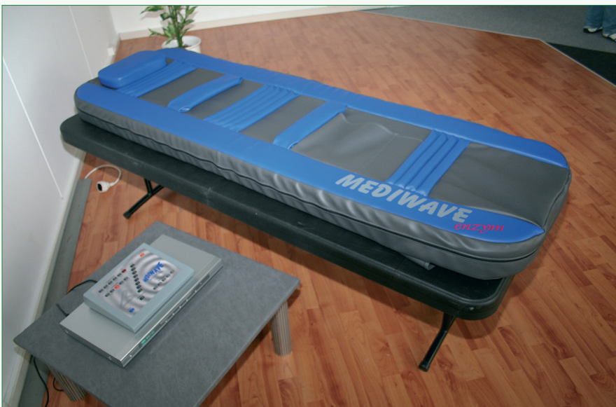
Abb. 1: Heilende Töne, interessantes Design: MEDIWAVE

Eine völlig neuartige, ganzheitliche Interventionsform ist auf dem Weg, die Naturheilkunde zu erobern. Dem auf den ersten Blick simplen Gedanken, Töne als Schall-schwingungen direkt auf den Körper, auf die Haut zu applizieren, könnte die Erkenntnis auf dem Fuße folgen, dass die wahren großen Dinge zunächst meist im Verborgenen und im Unscheinbaren blühen. CO`MED will sich mit einem Porträt über die vielfältigen Wellness- und Therapie-Möglichkeiten der Heilenden Töne daran beteiligen, dieses zarte Pflänzchen erstmals dem Licht der interessierten und fachlichen Öffentlichkeit auszusetzen.