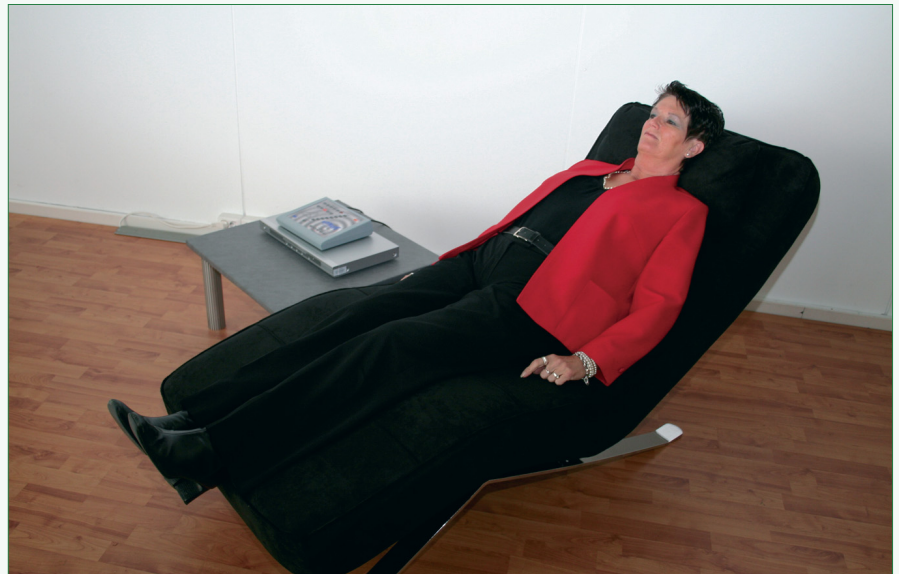
Abb. 3: MEDIWAVE, in der exklusiven Wellness-Ausführung