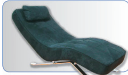
Liegen-Applikator (nur für ENZYMED professional)