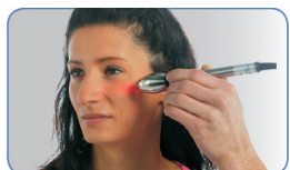
Licht-Stab-Applikator (rot, blau oder grün)